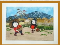
裂画『童画 柿の収穫』(1階受付カウンター)