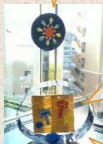
『夏の夜』(階段踊り場)