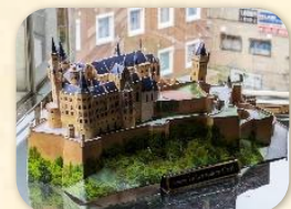
『ドイツ ホーエンツォレルン城』