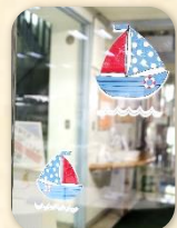
『ヨット』(1階事務室入口ドア)

ペーパークラフトの型紙はキャン クリエイティブパークより使用 https://creativepark.canon/