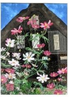
裂画 『古民家 コスモス』(3階)