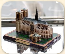
『フランス ノートルダム大聖堂』