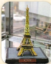
『フランス エッフェル塔』