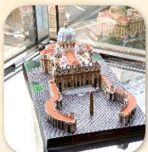
『バチカン サン・ピエトロ大聖堂』